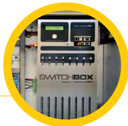
Cross Arco RS4